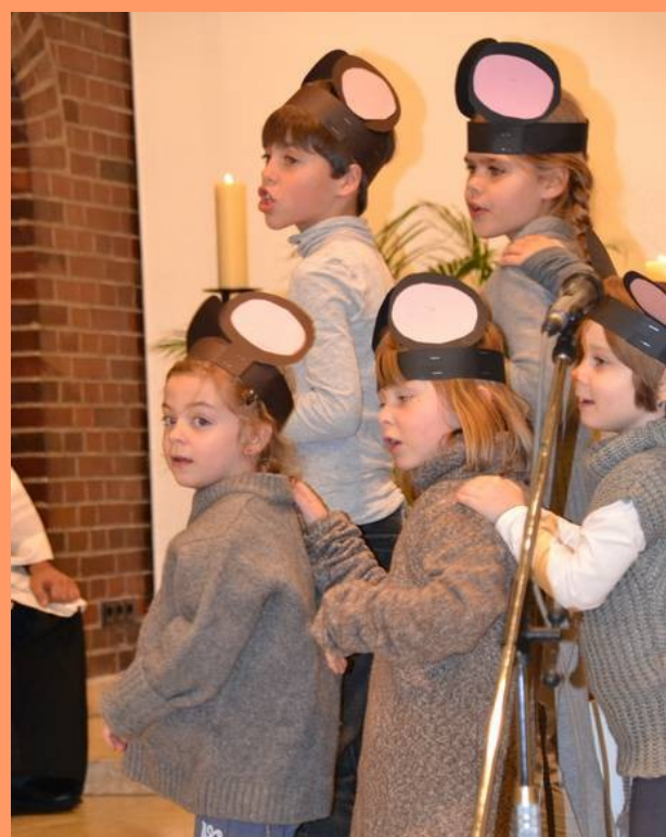
Kindermusical "Mäuse von Nazareth"